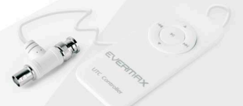
Kontroler zdalnego sterowania EVX-UTC-CRI