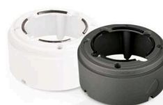
Pierścień mocujący EVX-CD-BI